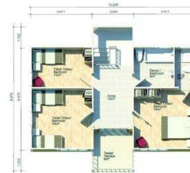
1. KAT PLANI / FIRST FLOOR PLAN