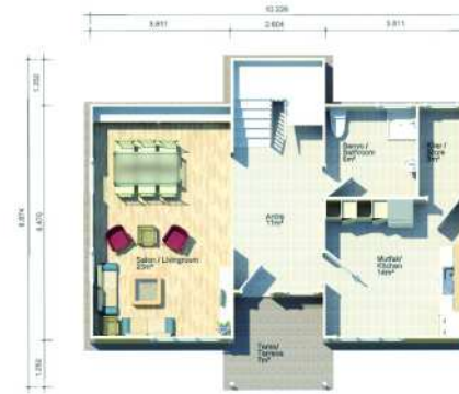
ZEMİN KAT PLANI / GROUND FLOOR PLAN