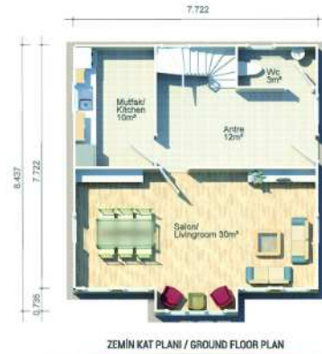
ZEMİN KAT PLANI / GROUND FLOOR PLAN 62m 2