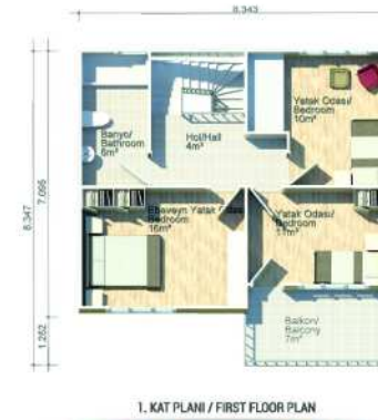
1. KAT PLANI / FIRST FLOOR PLAN 64m 2 (57m 2 + 7m 2 )