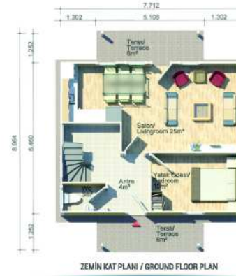
ZEMİN KAT PLANI / GROUND FLOOR PLAN 62m 2 (50m 2 + 12m 2 )