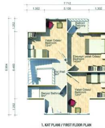
1. KAT PLANI / FIRST FLOOR PLAN 62m 2 (59m 2 + 3m 2 )