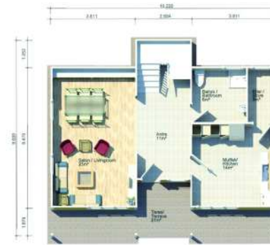
ZEMİN KAT PLANI / GROUND FLOOR PLAN