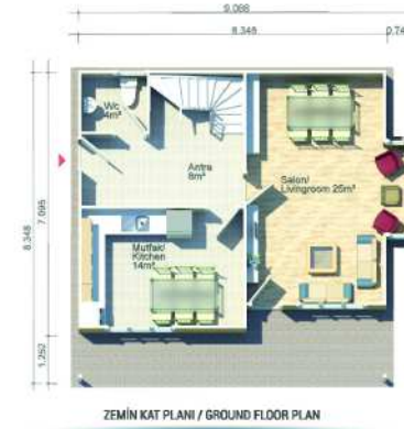
ZEMİN KAT PLANI / GROUND FLOOR PLAN 72m 2 (59m 2 + 13m 2 )