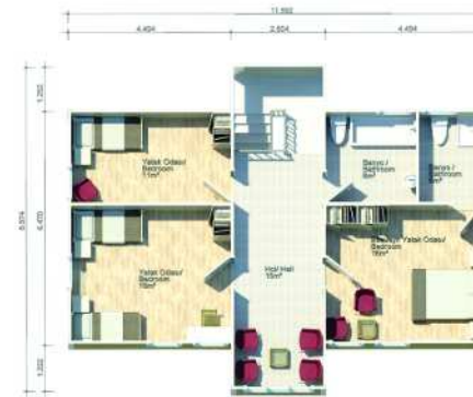
1. KAT PLANI / FIRST FLOOR PLAN