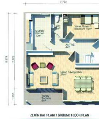
ZEMİN KAT PLANI / GROUND FLOOR PLAN 70m 2 (65m 2 + 5m 2 )