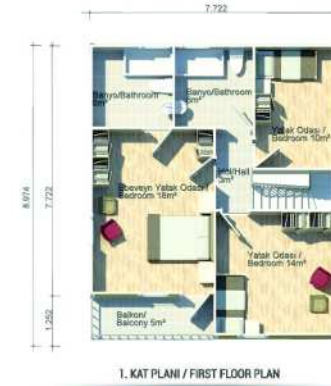
1. KAT PLANI / FIRST FLOOR PLAN 70m 2 (65m 2 + 5m 2 )